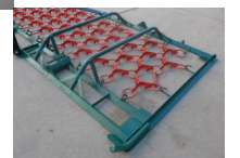
Wiesenschleppe Wiesenegge Profi 4m-4-reihig